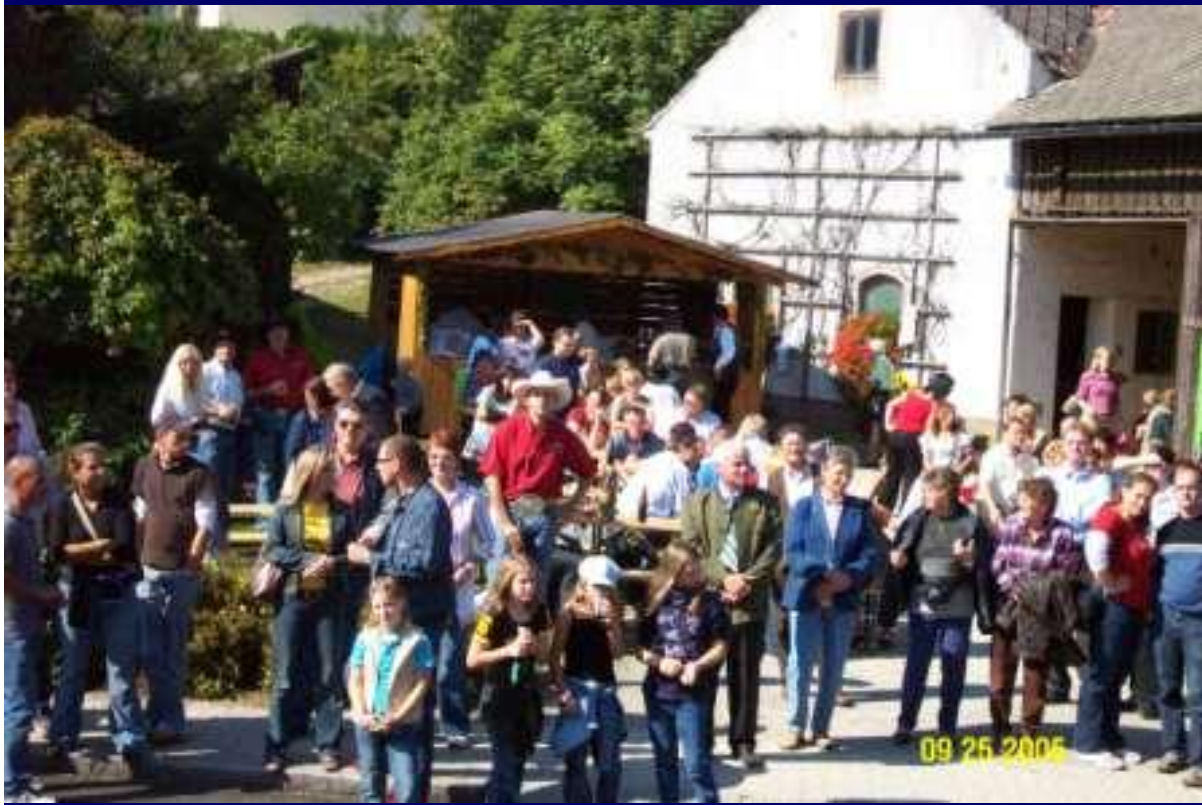
Mostviertler Spezialität - Feuerflecken